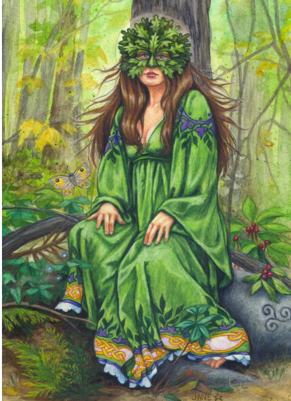
Bild „Green Lady“ mit freundlicher Genehmigung © Jane Star Weils – janestarrweilsart.com

Zweijährige Ausbildung zur Priesterin der Göttin www.priesterindergoettin.at